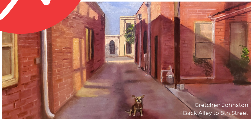
Gretchen Johnston Back Alley to 8th Street